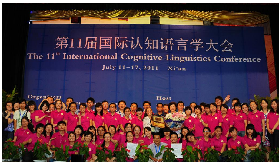
英文学院学生在第十一届国际认知语言学大会担任志愿者